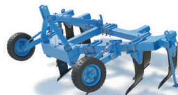
SVAROG ПЧ-4,5 (со стойками парашюта)